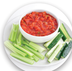
Vegetables with Salsa Veduras con salsa