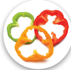
Bell Peppers Chiles campana