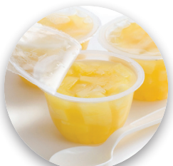
Fruit Cups Tazas de fruta