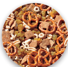
Trail Mix Mezcla de cereales y frutas secas