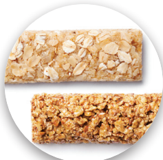
Cereal Bars Barras de cereal